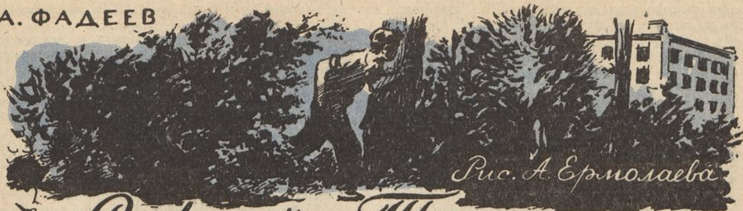
Рис. А. Ермолаева